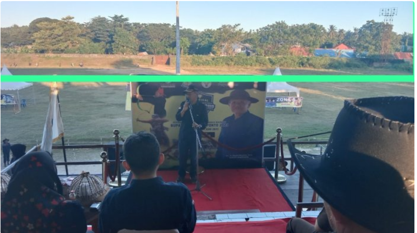
Potret sarana monumental lapangan Stadion Mini Turatea Kabupaten Jeneponto, Sulawesi Selatan.

JENEPONTO, SULSEL - Sarana monumental yang berbentuk Tribune tertutup ini, kini kondisinya tampak tidak terurus. Padahal, Stadion Mini Turatea ini merupakan satu-satunya lapangan serba guna kebanggaan masyarakat Jeneponto.